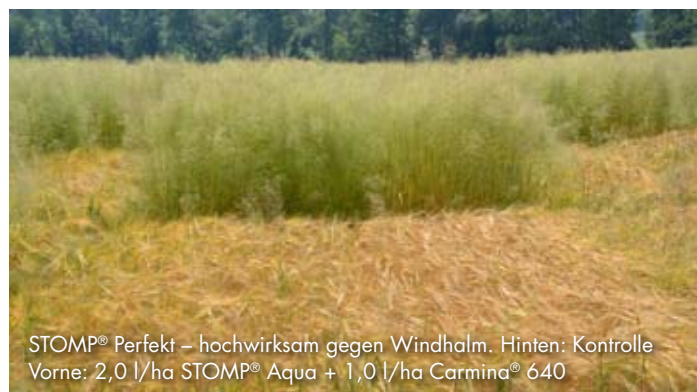
STOMP® Perfekt – hochwirksam gegen Windhalm. Hinten: Kontrolle Vorne: 2,0 l/ha STOMP® Aqua + 1,0 l/ha Carmina® 640

Der Synergismus zwischen den Wirkstoffen beider Produkte rundet das Wirkungsspektrum gegen eine breite Mischverunkrautung ab. Auch Ungräser werden von dieser Produktkombination sicher erfasst. Damit steht auch für drainagierte und gewässernahe Flächen ein Produkt zur Verfügung, das gegen Problemunkräuter wie Klettenlabkraut, Kornblume und Kamille perfekte Leistung zeigt.